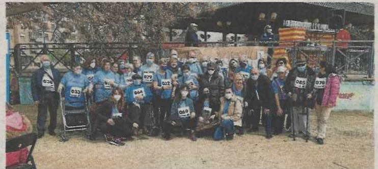
Carrera simbólica en la que participaron los usuarios. A.P.A.

nal, ya que un 5% de los diagnósticos se producen en personas menores de 50 años, aunque la prevalencia de la patología aumenta a partir de los 60.