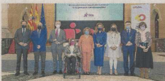
Imagen de la entrega de premios.