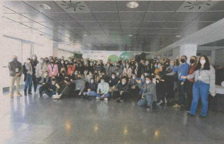
El WTC acogió la reunión para elaborar el plan estratégico. P.I.A.

El anterior plan estratégico de Plena inclusión Aragón estuvo