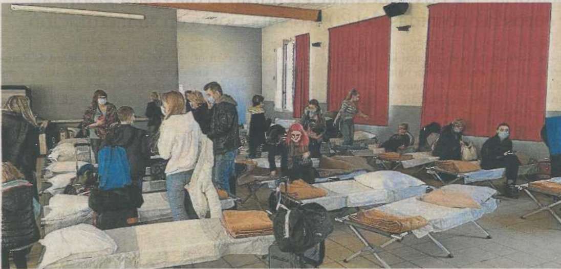
Centro de Cruz Roja en Besançon (Francia), donde los refugiados fueron atendidos por personal sanitario.

ZARAGOZA. Fundación Ibercaja apoya una nueva iniciativa de ayuda al pueblo ucraniano. Desde la entidad, se ha respaldado económicamente una acción voluntaria, impulsada por un empleado del Grupo Ibercaja en Zaragoza, que ha realizado un viaje